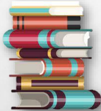
Nota Kursus & Slide Pembentangan