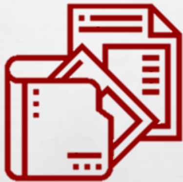
Pengurusan Rekod Pelaksanaan Kursus