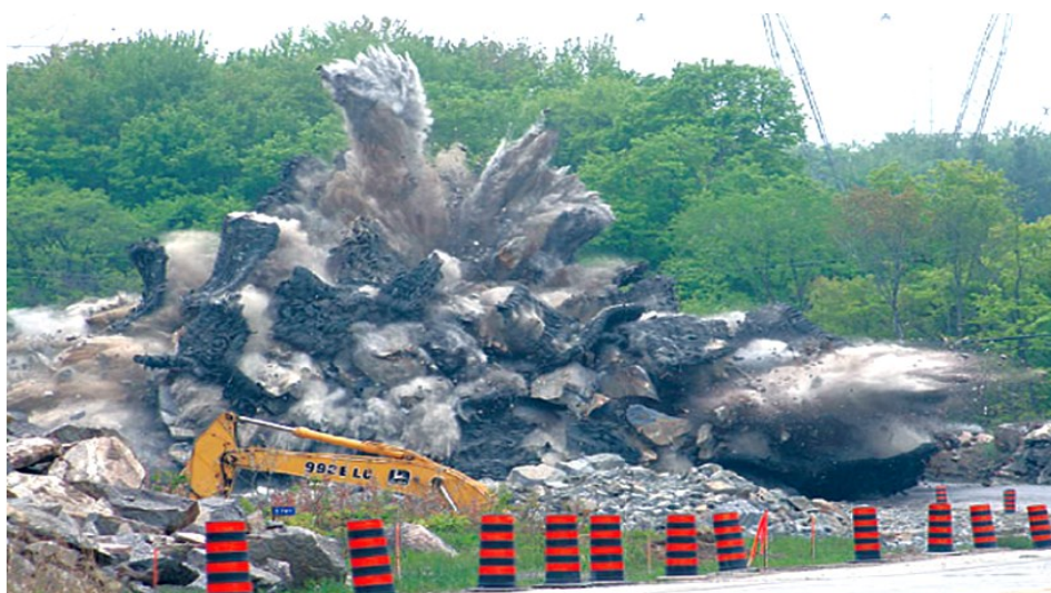
Kerja letupan batu di tapak pembinaan