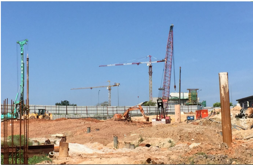
Kerja tanah di kawasan berbatu biasanya menggunakan kaedah letupan.